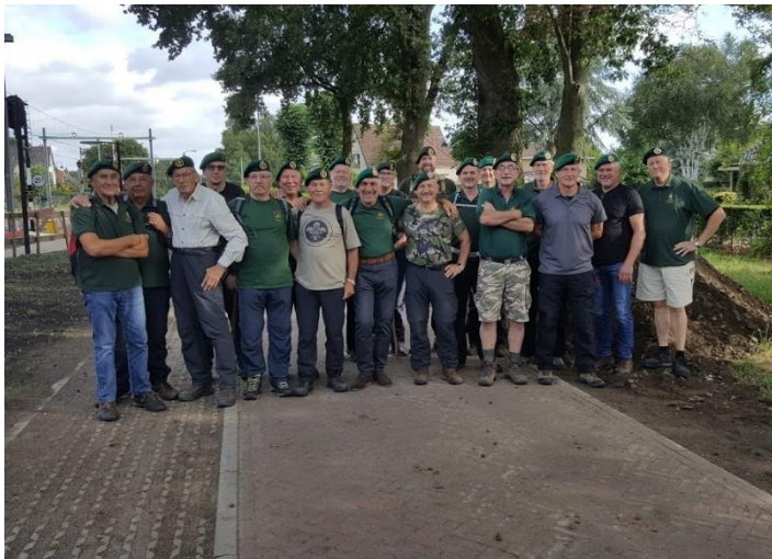
← De groep deelnemers.

Even verder net voor de ondergang van de A12 geluncht in het bos, daar werd door Wijnie mijn vrouw soep broodjes koffie en thee gebracht, de route vervolgd en door het bos bij de Buunderkamp uitgekomen, daar is het landingsveld LZ-S waar de 1e Luchtlandings Brigade is geland. Aangekomen in Wolfheze werden wij verrast door een groep reenactors die