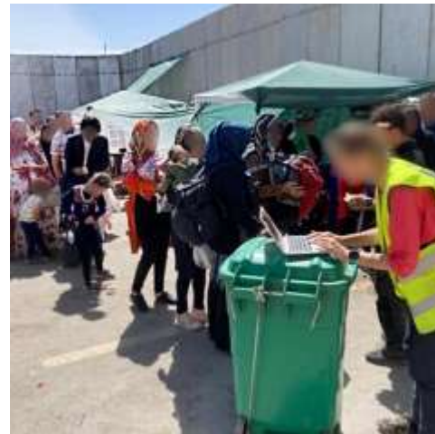
REGISTRATIE VAN DE VLUCHTELINGEN OP HET VLEGVELD VAN KABOEL