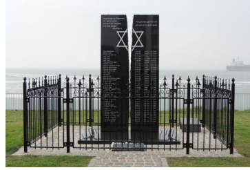
Joods monument Vlissingen