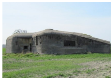
Antitankbunkers aan tankgracht bij Koudekerke