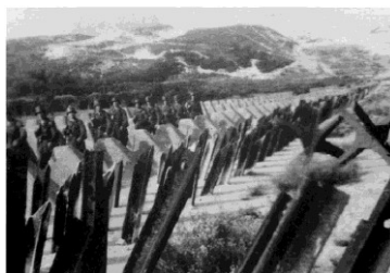
Höckerhindernisse (tankversperring) bij Groot Valkenisse toen en nu