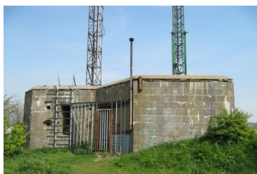
Communicatiebunker bij Koudekerke