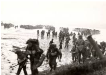
Uncle Beach (landingsstrand Vlissingen) met monument en waarnemingsbunker