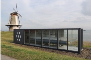
1-mans duikboot Biber