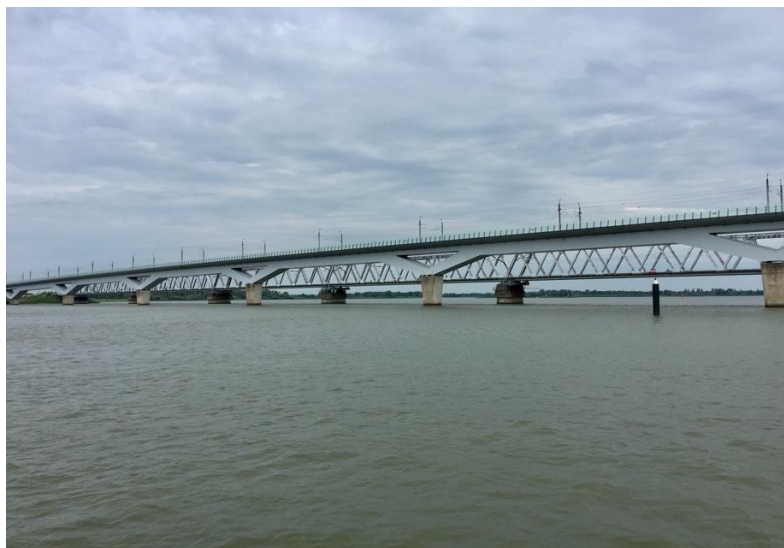
De brug voor de hogesnelheidstrein over het Hollands Diep...

We voeren onder de Moerdijkbrug door, de brug voor de hogesnelheidstrein ( welke zo'n 2 km lang is... ) en de oudere spoorbrug voor het normale treinverkeer.