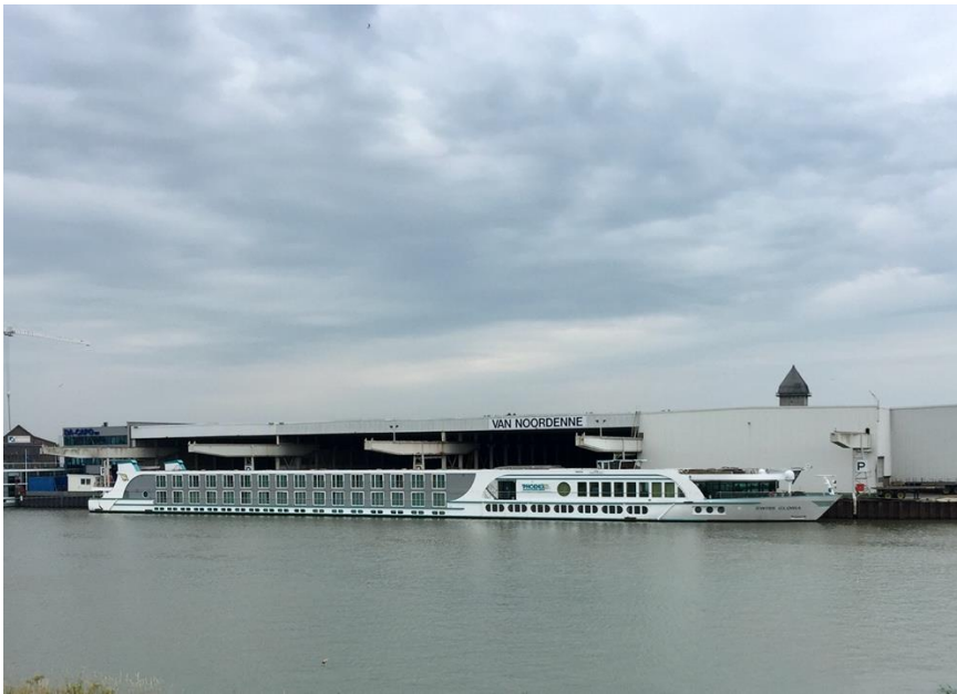
Eén van de vele cruise schepen, wachtend tot men weer in de vaart mag...