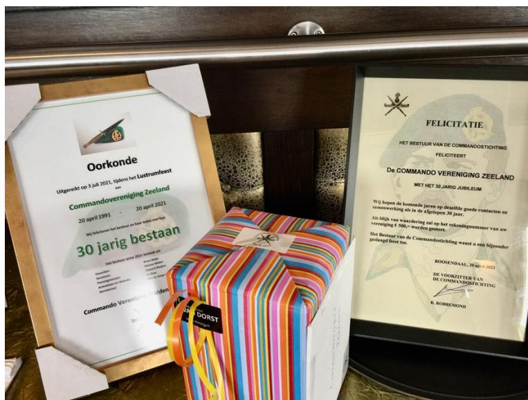
Links de oorkonde overhandigd door COV Midden-Nederland...

De jubileumcommissie maakten aansluitend een doos open, waarin een voorbeeld van een speciaal geslagen coin werd getoond.