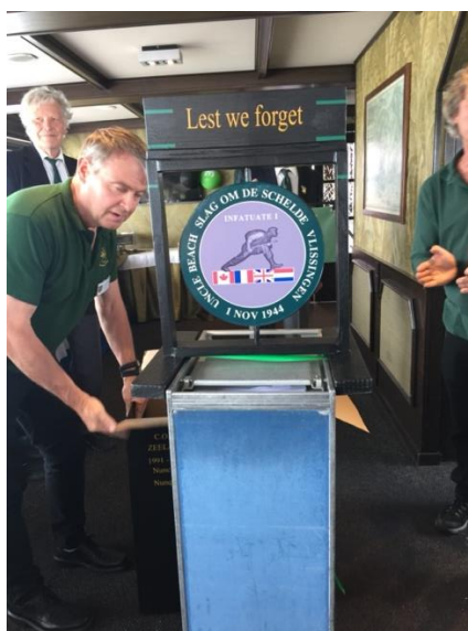
Het jubileumfeest was ten einde.

(deze is nu ook verkrijgbaar bij de Commando Toko...)