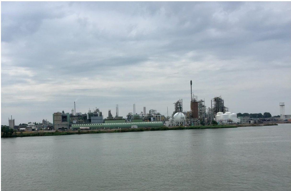
Het (petrochemische) industriegebied van Dordrecht...

De reis verliep met prachtige weersomstandigheden. Dit trok diverse aanwezigen om gebruik te maken van het bovendeck. Nadat we 's-Gravendeel waren gepasseerd gingen we richting het Hollands Diep. Ondertussen liep het naar etenstijd en werden de voorbereidingen hiervoor getroffen. We werden verwent met een heerlijke uitgebreide lunch. Buiten de kaas- en vleesgerechten waren er kroketten, gehaktballen en diverse soorten brood.