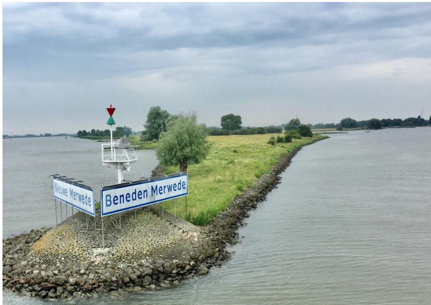
De overgang van Nieuwe Merwede en Beneden Merwede...

Daarvandaan draaiden we “de Beneden Merwede” op.