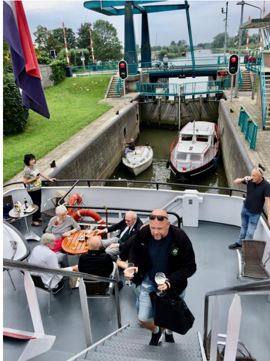
De boot in de schutsluis bij Werkendam...

De kapitein had er goed het oog in, want er zat aan beide zijden van het schip een paar cm ruimte tussen schip en muur.